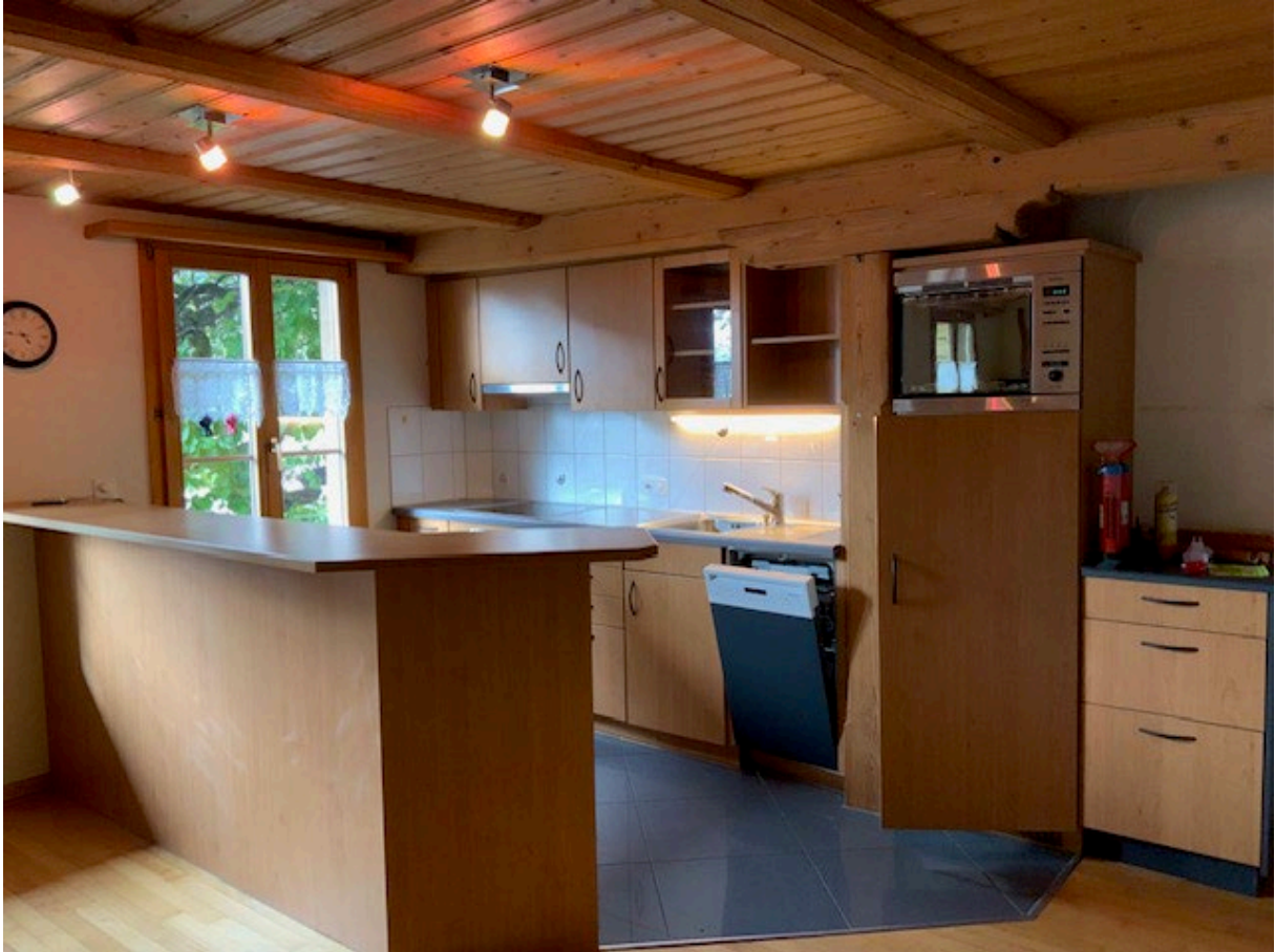
Wohnung im 1. OG mit Küche