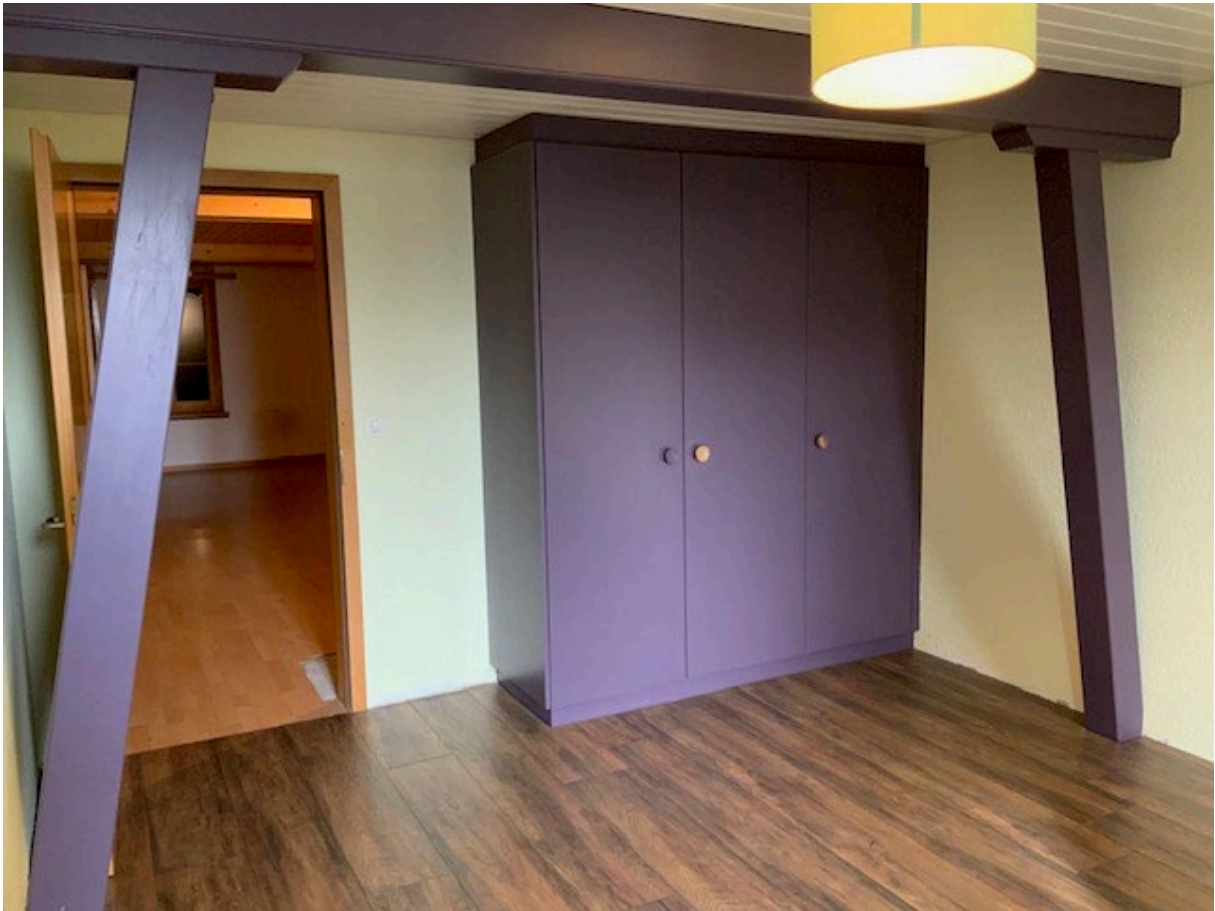
Weitere Zimmer im OG