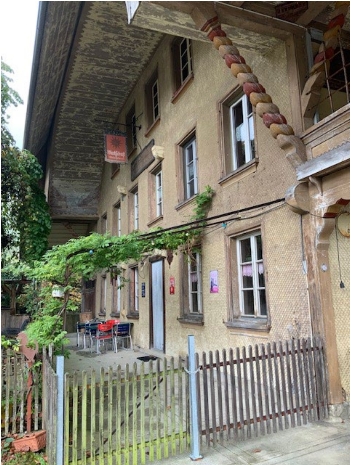
Westansicht und Sommergarten