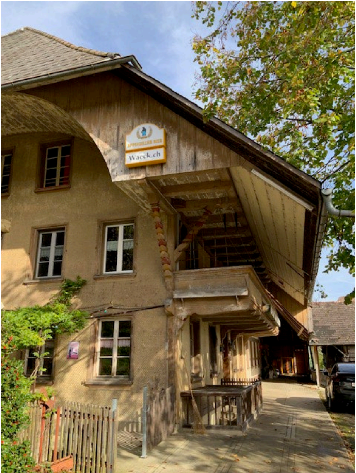
Vorplatz mit Keller Zugang